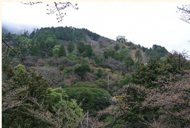
くすの木から花木園を望む