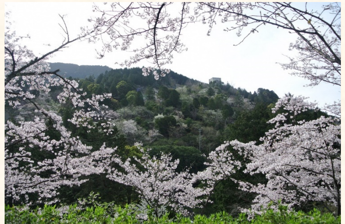
くすの木から花木園を望む