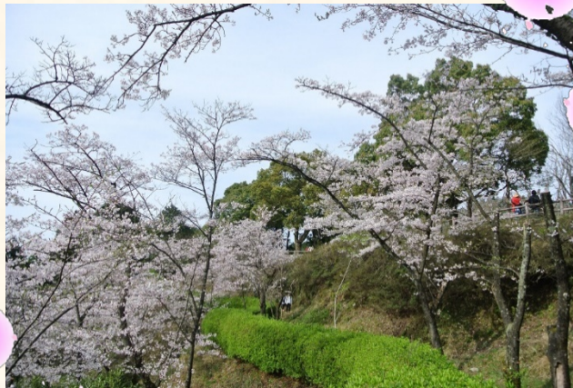
くすの木をバックに