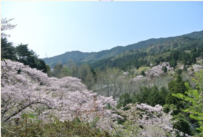
◆くすの広場から管理事務所を望む