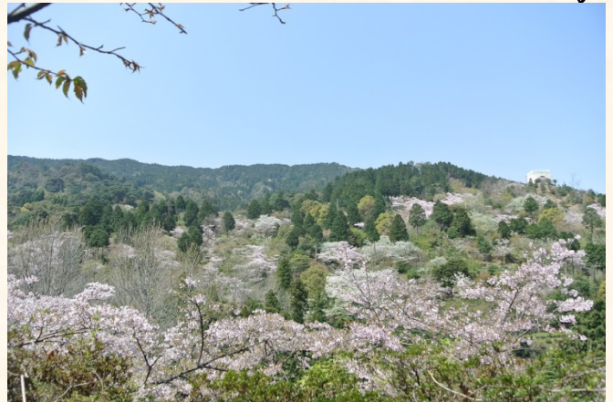
◆くすの広場から花木園を望む