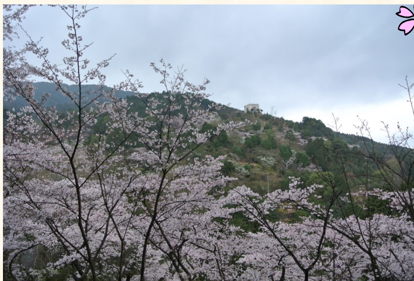
◆くすの木から花木園を望む