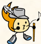
城南区シンボルキャラクター 油山の妖精ニッコりん