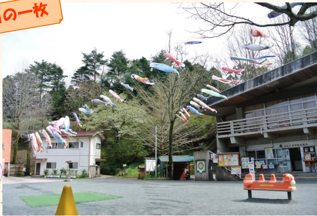
◆管理事務所前のこいのぼり