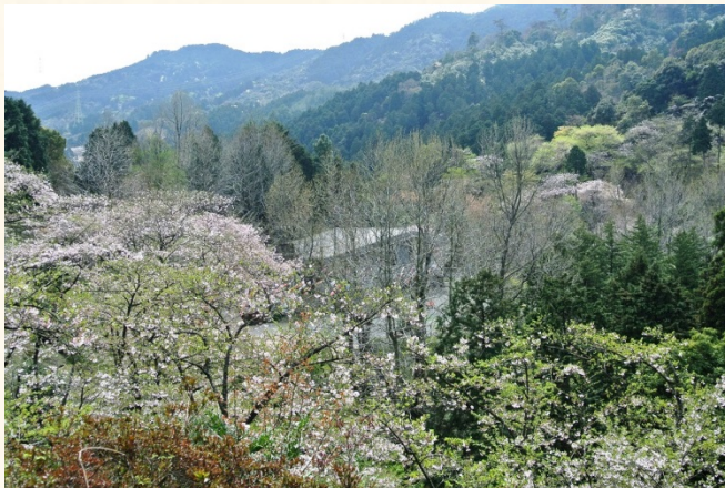
◆くすの広場から管理事務所を望む