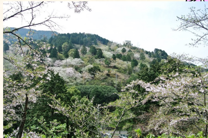
◆くすの広場から花木園を望む