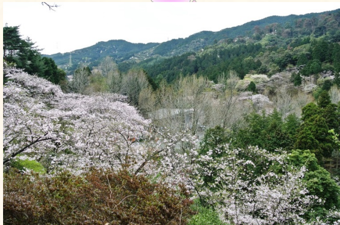
◆くすの広場から管理事務所を望む