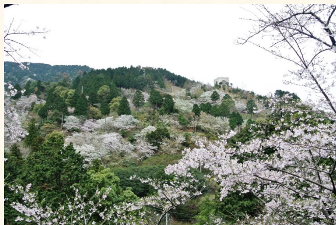
◆くすの広場から花木園を望む