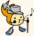
城南区シンボルキャラクター 油山の妖精ニッコりん