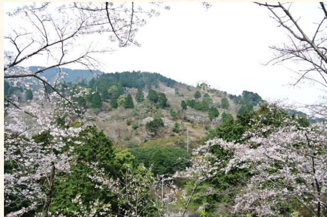
◆くすの木から花木園を望む