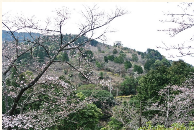
◆くすの木から花木園を望む