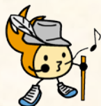
城南区シンボルキャラクター 油山の妖精ニッコリン