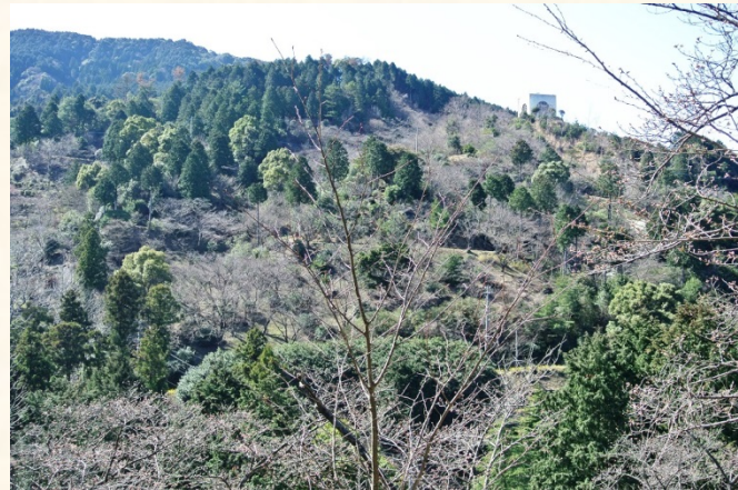
◆くすの木から花木園を望む