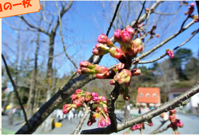
◆陽光桜（ヨウコウザクラ）