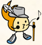
城南区シンボルキャラクター 油山の妖精ニッコりん