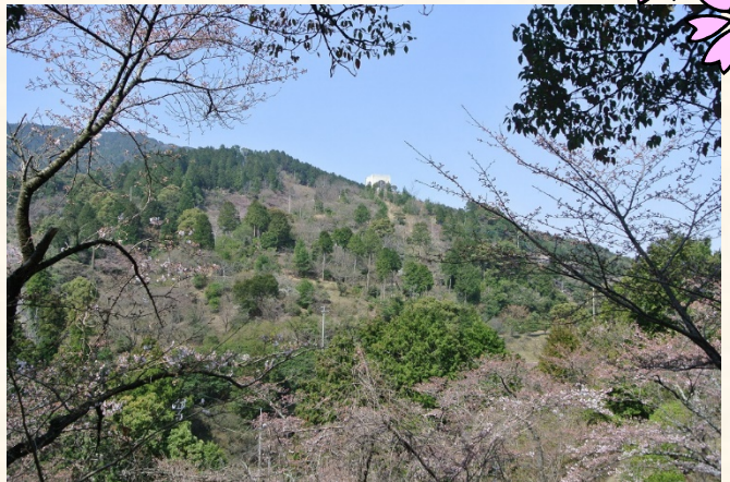
くすの木から花木園を望む