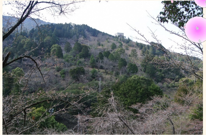
くすの木から花木園を望む

《お問い合わせ》 企画共創課(2階22番窓口) 電話 833-4009 FAX 844-1204