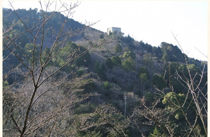
くすの木から花木園を望む