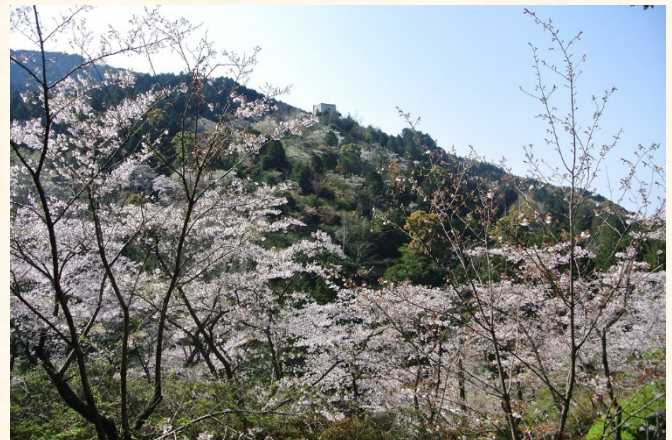
くすの木から花木園方向