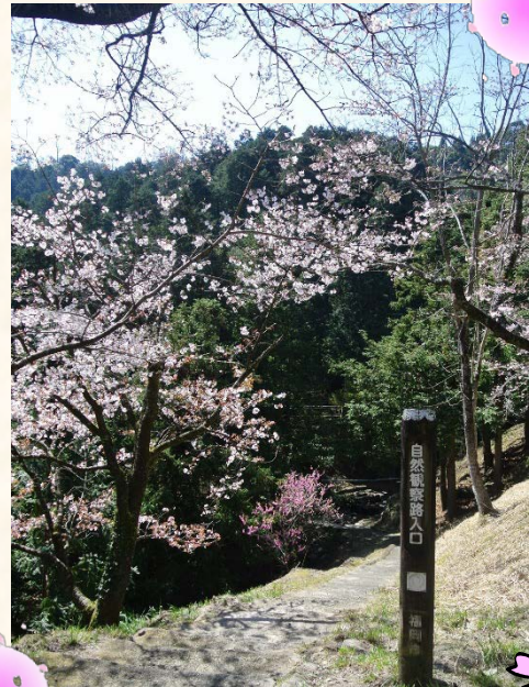
サクラとハナモモ