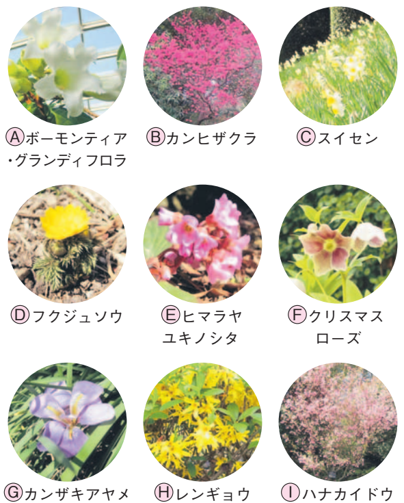
A ポーモンティア・グラディフロラ