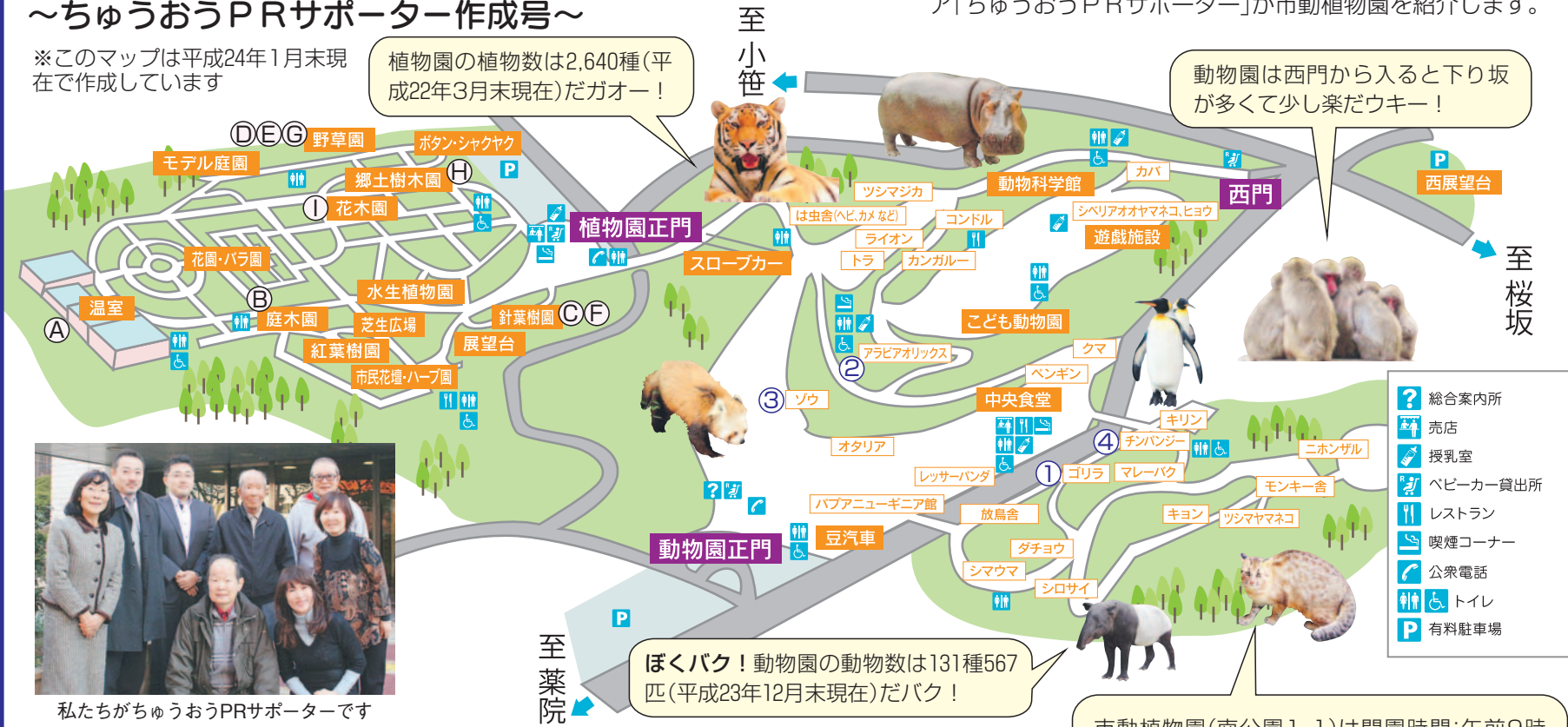
私たちがちゅうおうPRサポーターです