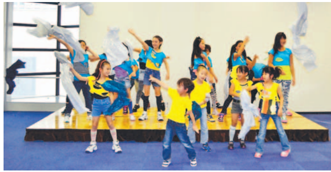
躍動感あふれるHip Hop Kidsのヒップホップダンス