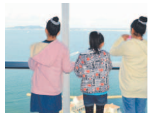
遠くまでよく見えるね