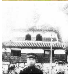
現在の祈念櫓(上)と火灯窓のある祈念櫓の古写真(下)

北東の方角は鬼門といわれ、昔から邪悪な鬼が入りすると考えられてきました。そこで本丸の鬼門を守るために北東隅に建てられた櫓が祈念櫓です。