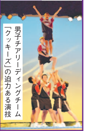
男子チアリーディングチーム「クッキーズ」の迫力ある演技

見に来て、参加して、楽しんで！ 「区市民文化祭」で世代を超えた交流を 区市民の祭り運営委員会は、芸術・演劇の発表、鑑賞を通して、区民の世代を超えた交流と地域への愛着を深めようと「中央区市民文化祭」を毎年開催しています。32回目を迎える今年度も、多くの区民が参加しました。