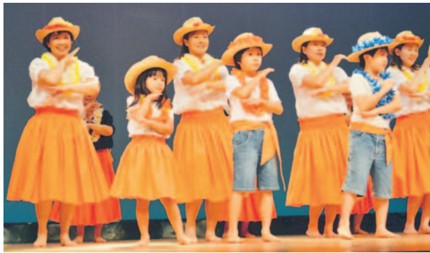
笹丘校区は3世代でフラダンスを披露

11月12日、中央市民センターで行われた音楽と演芸のつどい。華やかな衣装でフラダンスを披露したのは笹丘分校。