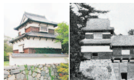
現在の(伝)潮見櫓(左)と太鼓櫓の古写真(右)

「潮見櫓」と呼ばれていた櫓の棟札から「潮見櫓」の調査を行ったときのことです。「月見櫓」と呼ばれていた櫓の棟札から「潮見櫓」の調査を行ったときのことです。「月見櫓」と呼ばれていた櫓の棟札から「潮見櫓」の調査を行ったときのことです。