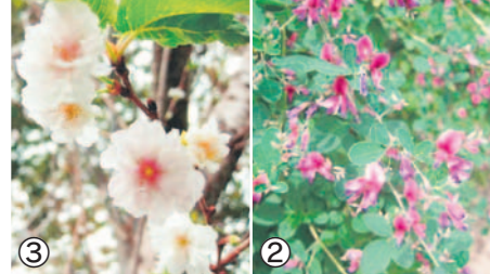
①秋のバラ園 ②マメ科の「ハギ」 ③秋に咲く桜「ジュウガツサクラ」

優雅さと高貴な香り、人気の高い四季咲きのバラは、春と秋の年2回開花のピークを迎えます。春は花が大きく、同時期に咲きそろう豪華で見応えがある一方、秋はやや小ぶりではありますが、長い期間楽しめます。動物園再整備で広くなった「バラ園」では、約250種1200株が