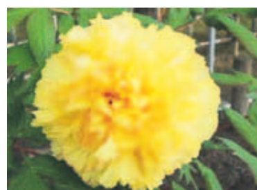
ボタンの1種・キンシ

ソメイヨシノをはじめとする桜の時期も過ぎ去り、5月はボタンやシャクヤクなどが咲く季節です。舞鶴公園内にあるボタン・シャクヤク園には、ボタンを約400株、シャクヤクを約1400株植栽しており、4月下旬から5月中旬まで咲き続けます。園の中央には、花が見頃を迎える時期限定で、高さ約1.5mの花見台を設置しており、少し高い位置から多くの花を愛でることが出来ます。