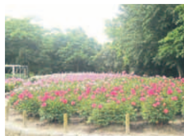
鮮やかに咲くシャクヤク

●駐輪料金は1日1回100円から。駐輪場により異なるので、現地でご確認ください。