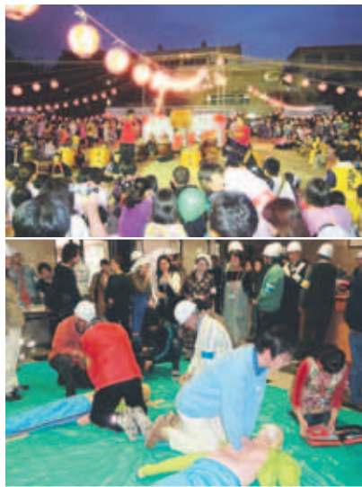
(上)毎年たくさんの人でにぎわう校区の夏祭り(下)非常時に備え定期的に行っている応急手当の実習訓練