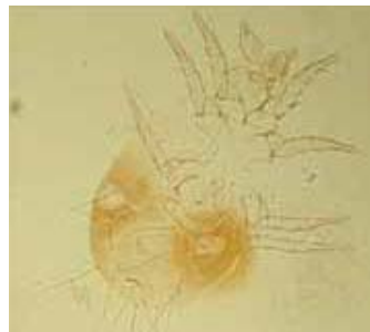
ケナガコナダニ(約0.4mm)

食品に発生することが多く、繁殖するために最適な条件が揃うと、短期間で一気に増えます。白い粉のようなものが固まりになって、動いて見えます。