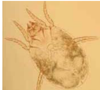
コナヒョウヒダニ(約0.2～0.4mm)

人が住むところに必ずいるダニがチリダニ類です。チリダニ類で代表的なのは、コナヒョウヒダニ、ヤケヒョウヒダニです。チリダニ類は、ダニアレルギーの原因No.1で、死骸や糞もアレルギーの原因物質となります。チリダニ類と次に紹介するコナダニ類は、人の血を吸ったり、刺したりすることはありません。