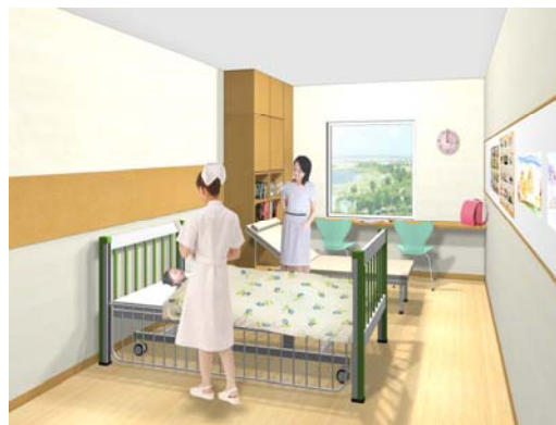
子ども達が安心して医療を受けることができる あたたかさを感じる「いえ」を意識した病室 (4・5階個室)のイメージ