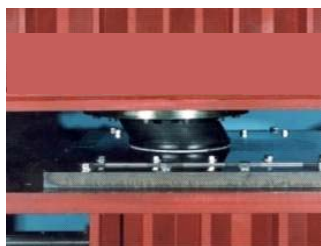
弾性すべり支承実験状況 (建設企業 開発)