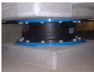
天然ゴム系積層ゴム 設置状況