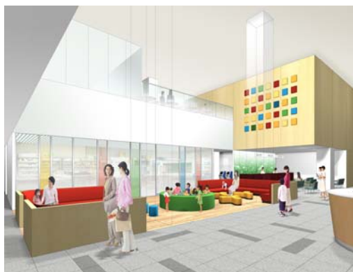
1階センターホールのプレイコーナーのイメージ (待合室など施設の各所にプレイコーナー、 プレイルームを設置)