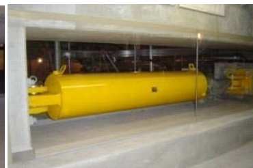
オイルダンパー設置状況