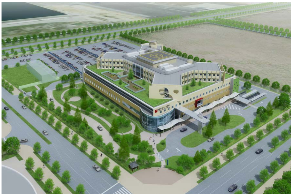
子どもの療養環境に配慮した緑あふれる病院外観イメージ

※ 下記の図は提案されたイメージ図です。今後の設計協議により、変更になることがあります。