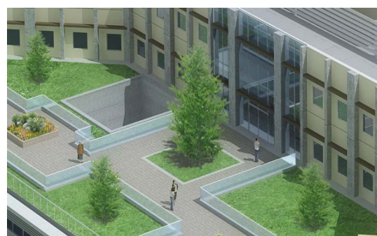
屋上庭園のシンボルツリー