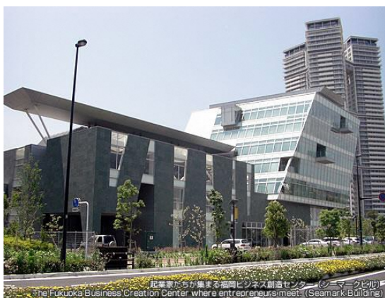
シーマークビル外観 (3階にサイバー大学キャンパスを設置)