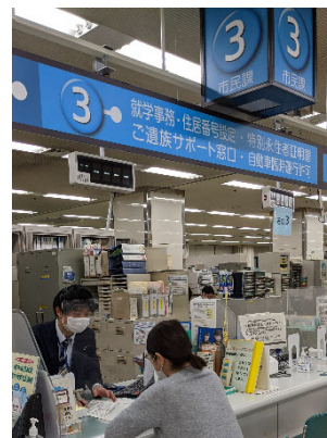
(参考) 中央区のご遺族サポート窓口

来庁時には実際に手続きを行う窓口をご案内します。希望に応じて、申請書の作成のお手伝いや、窓口への付き添いも行います。