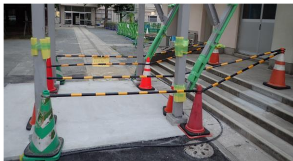
○カラーコーン及び緩衝材の設置状況