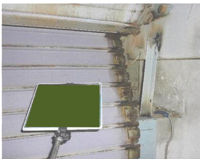
スチール製曲物設置