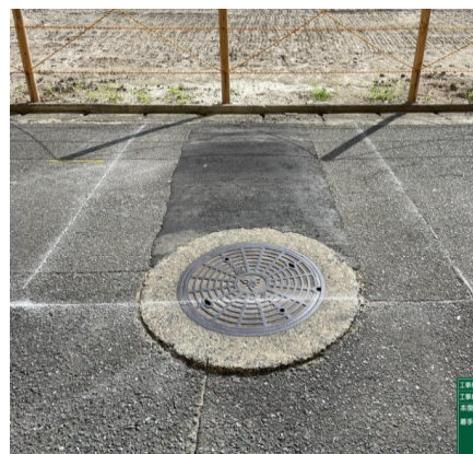
[資料2:マーキング写真]