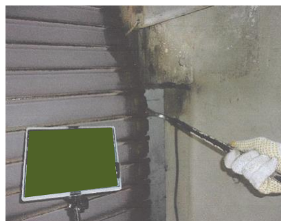
降下時パール使用