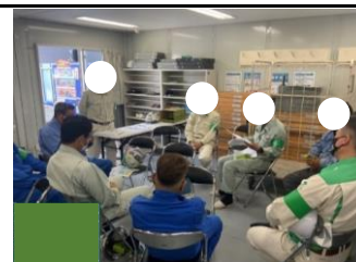
作業手順の再周知会