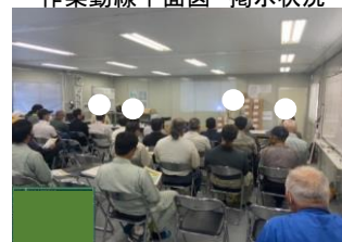
安全教育実施状況