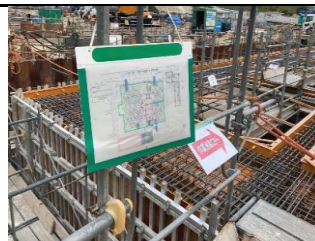
作業動線平面図 掲示状況