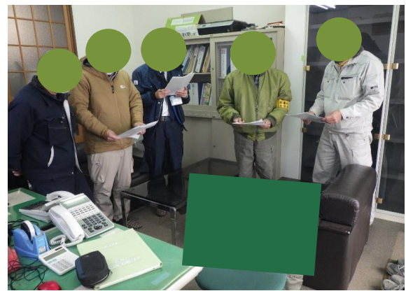
事故再発防止のための安全訓練