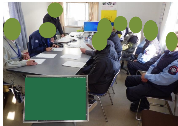
事故再発防止のための安全訓練