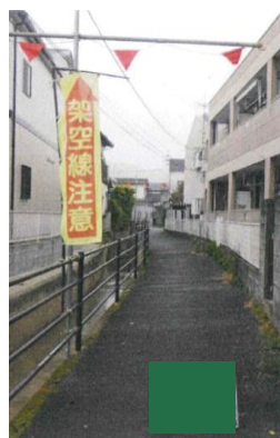
架空線高さの標識を設置