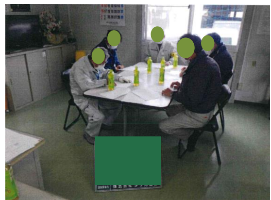
事故再発防止のための安全訓練