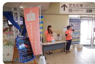
イベントでの募金活動