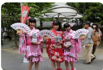
博多どんたく港まつりでの 募金活動（官兵衛ガールズ）