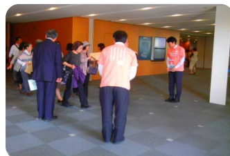
会議場での募金活動