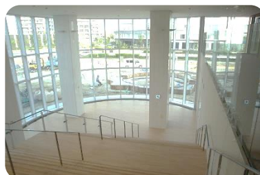
インフォメーションギャラリー