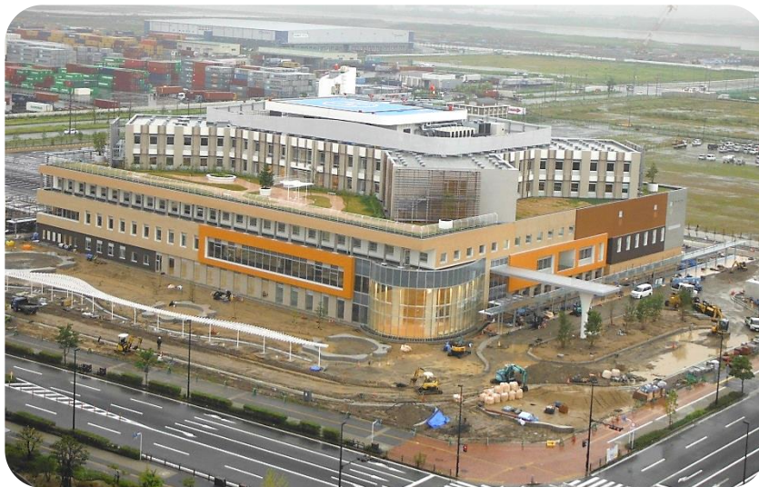
建設現場全景（アイランドタワー15Fより平成26年7月撮影）