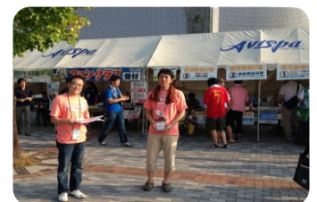
レベルファイブスタジアム での募金活動