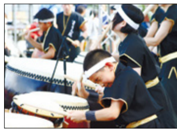
博多どんたく港まつり 東区演舞台のフイ ナールを飾る綾杉太鼓 の演技(昨年)