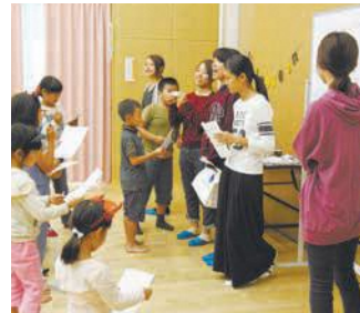
大学生の手作りゲームが大盛況

「香住っ子ひろば」は、夏休み期間を除く毎月2回(土曜日)、香住丘公民館で開催されています。大学生がレクリエーションの企画などを行