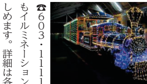
海の中道海浜公園の機関車(昨年)。今年は12月18日・19日・24日・25日に点灯

クリスマスシーズンには、街中にイルミネーションが灯ります。公民館など区内のイルミネーションを紹介しします。