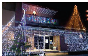
2つのツリーが輝く香椎下原公民館(今年)

公民館のほか、福岡女子大学(📍同同大学 ☎61-2418)や海の中道海浜公園(📍同同公園 ☎651-5097)へ。