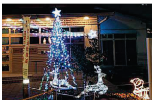
トナカイたちが出迎える箱崎公民館(昨年)

公民館のほか、福岡女子大学(📍同同大学 ☎61-2418)や海の中道海浜公園(📍同同公園 ☎651-5097)へ。