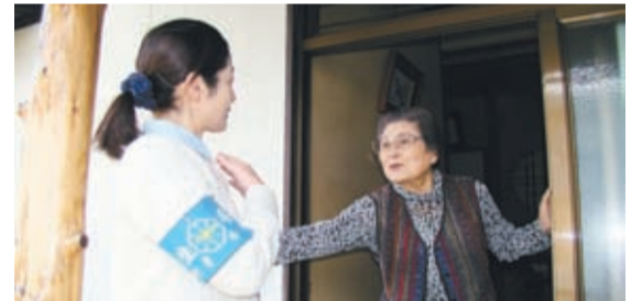
自宅を訪問し、笑顔で声掛けをします

※ ひまわりひろばでの作品展は6月10日(出)まで開催されます。6月5日(月)以降は午前9時から午後5時まで。