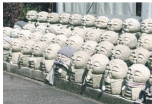
たくさんのお地藏さんが並んでいます

延命地蔵尊を本尊とするこの寺で目を引くのが、前庭にある「子育・水子地蔵尊」です。説明板には、「愛する子供の健やかな成長を祈り、水難・交通事故・病氣、そのほか不幸の為に、この世をさられた幼子達、また悲しいさだめの故に、この世に生まれることなく旅立った魂を慰める」と記してあります。亡くした子の供養のために、毎年5・6組の親御さんが寺を訪れます。