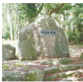
貞明皇后の行啓記念碑