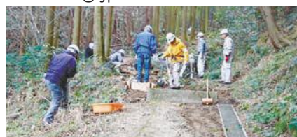
活動する「楽友会」の皆さん

随時募集しています。申し込み方法など詳しくは問い合わせ先へ。㊟立花山・三日月山保全ボランティア「楽友会」事務局(区企画振興課) ☎645-1037 ㊟651-5097 ㊟kikaku.HIWO@city.fukuoka.lg.jp