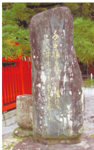
明治14年から「綾杉」の傍らに立っている歌碑

この由来は広く知られていたのか、約800年前の古今和歌集に「よみ人知らず ※千早振香椎の宮の綾杉は神の御衣木(みそぎ)に立てるなりけり」の一首があり、この古歌を刻んだ碑が綾杉の傍らに立っている歌碑