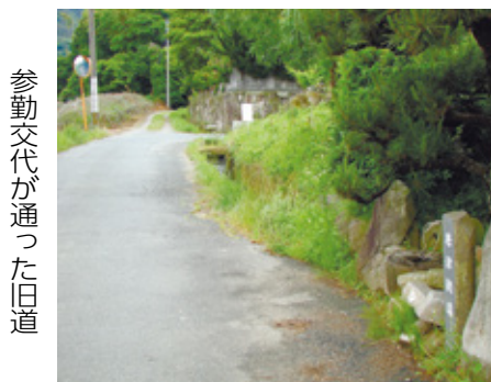
参勤交代が通った旧道

◆ 主に筑前黒田藩・肥前唐津藩主が参勤交代に使った唐津街道は、寛永19(1642)年の畔町宿(あぜまちしゅく)の新設により完成し、当時は筑前街道とも呼ばれていました。和白と新宮町原上の境界に残る街道はまさしく古街道にふさわしい旧道(現在は林道扱い)として息づいています。