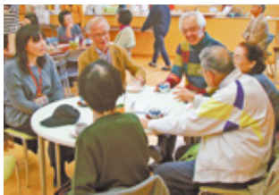
地域カフェで交流

地域の特性に応じたまちづくりの支援や地域活動の担い手の育成。子育て支援や児童虐待防止、地域包括ケアシステムを推進します。地域コミュニティとの交流促進など外国人居住者を支援します。