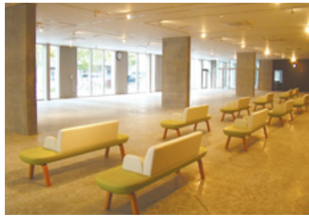
なみきスクエア1階のひまわりひろば

詳しくは、区ホームページ(「平成28年度東区区政運営方針」で検索)もしくは、区企画振興課で配布している冊子で紹介しています。【問い合わせ先】区企画振興課 ☎ 645-1014 ☎ 651-5097