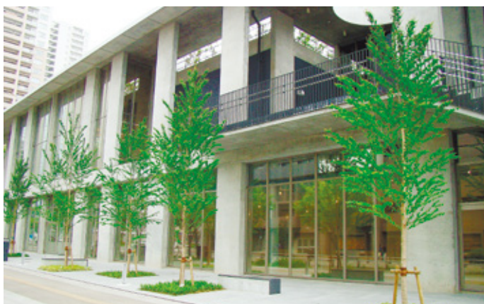
香椎副都心公共施設の愛称：なみきスクエア