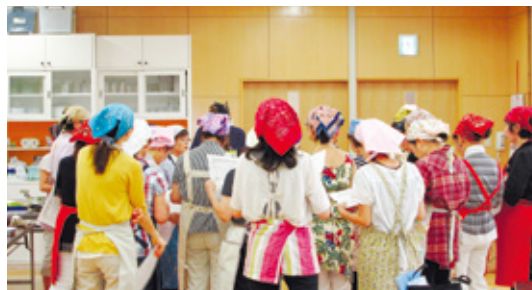
栄養の基礎知識を学びながら調理