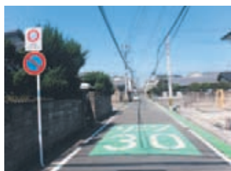
路面標示と道路標識

ゾーン30は、地域住民と東警察署が協議し、整備されます。ゾーン内は最高速度の時速30㎞を順守し、通り抜けを控えてください。