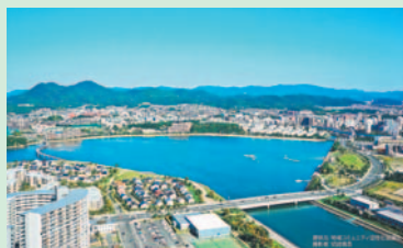
「御島グリーンベイクウォーク」周辺

博多どんたく港まつり東区演舞台を出発地・到着地とするウオーキング大会の参加者を募集します。コースは、「御島グリーンベイクウォーク」を通る約6㎞です。【日時】5月3日(祝)午前9時半～正午。小雨決行【場所】東区演舞台(香椎保育所横)集合【定員】先着500人【料金】500円(保険料やバザー食事券代など含む)。未就学児は無料【申し込み】往復はがきに代表者の住所・氏名(ふりがな)・電話番号と参加者全員の氏名(ふりがな)・電話番号を書いて、問い合わせ先へ。受け付けは、4月1日(金)から15日(金)まで。未就学児は保護者同伴【問い合わせ先】区企画振興課(〒812-8653住所不要) ☎645-1037 ☎651-5097