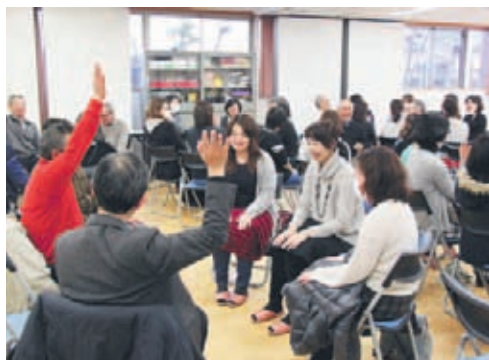
簡単なゲームを通して子どもとの接し方を学ぶ参加者

「地域で大人が考える子どもフォーラム」 地域で子どもを育むネットワークづくりを進めるため、名島公民館で2月27日に、「第7回子どもフォーラム」が開催されました。地域のボランティアスタッフ、子どもにも関する団体や、学校関係者などが参加。スマートフォンや携帯ゲーム機の普及など子どもたちを取り巻く環境などについて説明を受けました。