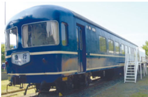
ブルートレインの車両「ナハネフ22」

貝塚公園に常時展示しているブルートレインと蒸気機関車の車内を公開します。☎3月25日(土)、26日(日)の午前10時～正午と午後1時～3時。※荒天の場合は公開を中止する場合があります。☎貝塚公園(箱崎七丁目) ㊟無料 ㊦不要 ㊧区維持管理課 ☎645-1058 ㊟632-8999