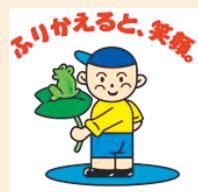
口座振替加入勸奨キャラクター ふりかえる君

「口座振替依頼書」に必要事項を記入・金融機関届出印を押印のうえポストに投函してください。口座振替依頼書は納税通知書に同封されています(軽自動車税を除く)。