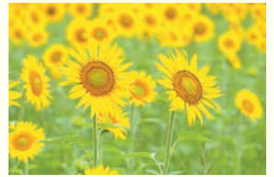
脇山校区のひまわり

開 = 日時 所 = 場所 問 = 問い合わせ ☎ = 電話 ㊟ = ファクス 対 = 対象 定 = 定員 料 = 料金、費用 持 = 持参 託 = 託児 申 = 申し込み 電 = メール 開 = 開館時間 休 = 休館日