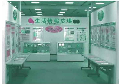
※写真は去年の様子