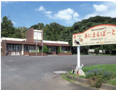
東部動物愛護管理センター