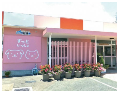
家庭動物啓発センター