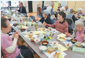
昼食を楽しむ皆さん

4月11日には、80~90歳代を中心に約40人が参加し、3色野菜の豚肉巻きや郷土料理「めたえ」、つくしの佃煮など、春らしいメニューを味わいました。参加者からは「1人暮らしで人と話す機会が少ないので、皆さんと話しながらおいしい昼食を食べられるのが毎回楽しみです」などの声が聞かれました。