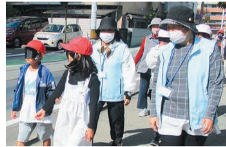
アイマスク体験をする児童をそばで見守ります

民生委員は児童委員も兼ねていて、赤ちゃんのいる家庭を訪問する「子育て安心サポート事業」(希望者のみ)などの子育て支援を行っています。