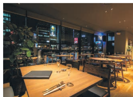
オ・ポルドー・フクオカ ☎午後5時～11時(土曜日は午前11時30分から)、日曜・祝休日は午前11時30分～午後9時 ☎月曜日