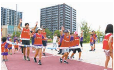
天気良ければ体育館外周も走ります

＜申し込み方法＞申込書に必要事項を記入の上、メール(☎f-marathon@city.fukuoka.lg.jp)で申込先へ。申込書は大会ホームページ(「福岡マラソン2024」で検索)からダウンロードできます。