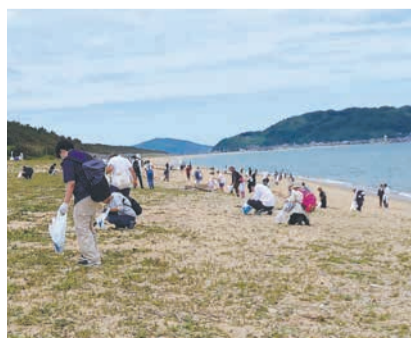
東区・海の中道本部会場(昨年)

当日は、飲み物・帽子・タオル・軍手を持参してください。詳細は市ホームページ(「福岡市 ラブアース」で検索)を確認を。