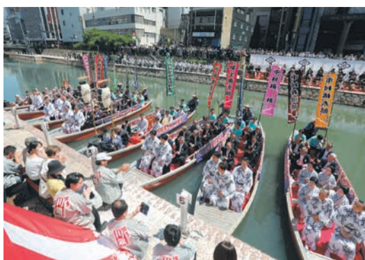
川端ぜんざい広場前(博多区上川端町)

「六月博多座大歌舞伎 船乗り込み」が、5月30日(木)に実施されます。「船乗り込み」は、歌舞伎俳優が船に乗ってご当地到着を知らせる、江戸時代から続く