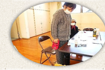
合間に張り切って握力測定