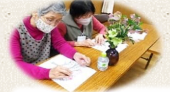
絵にかいた桜の木に花びらを 貼り付けています。