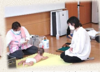
発育チェック・健康相談