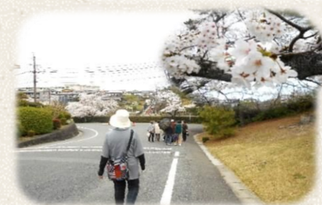
花雲りの中、満開の桜を楽しみました。