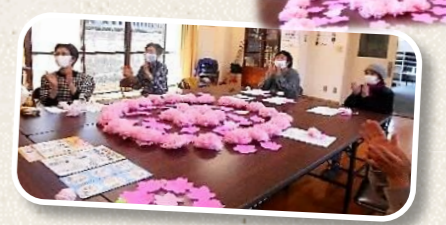
色紙を桜に見立て素敵にできました。