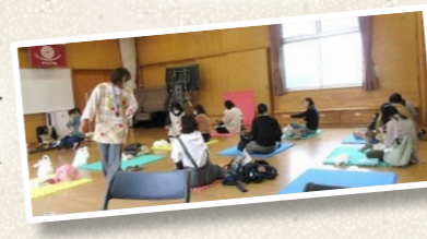
保健師より子供に対するの諸注意事項