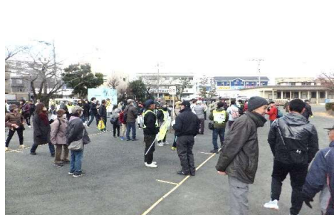
ウォーキング集合

また『花畑消防分団』の団員さん方からは、消火訓練のお話しと消火器の使い方について、ご指導していただきました。参加した子ども達も熱心に聞き入る姿がとても印象的でした。