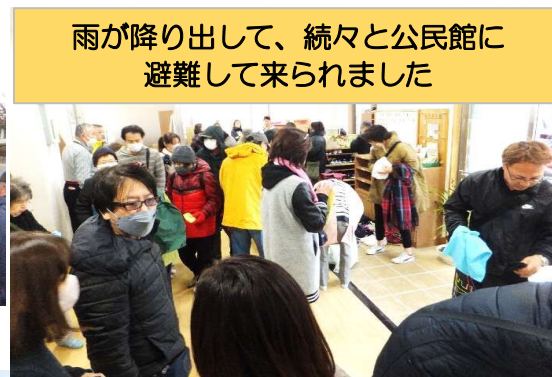
雨が降り出して、続々と公民館に避難して来られました